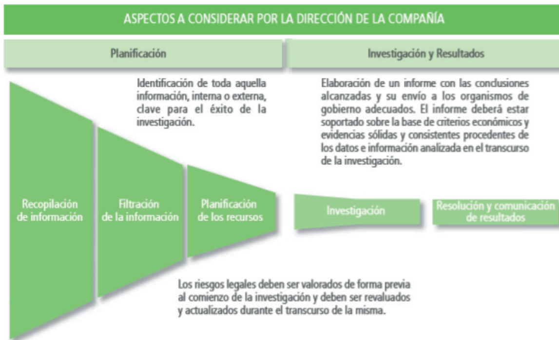
Figura 2. Aspectos a considerar por la alta dirección en la investigación

Adicionalmente, el IAI (2015, p. 122) indica los aspectos a considerar por la alta dirección en la investigación son: