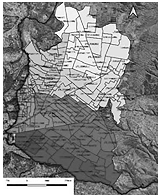
Censo 2001 Número de polígonos: 190

digitalización de los sectores identificados en cada uno de los tres censos analizados para la aplicación de la tabla antes mencionada, proceso que gráficamente generó la información que encontramos a continuación en la figura 3.