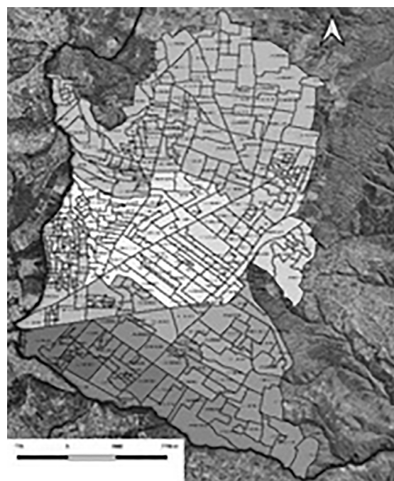
Censo 2010 Número de polígonos: 378