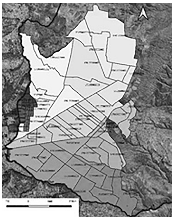
Censo 1990 Número de polígonos: 81